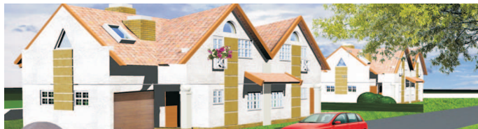
działka inwestycyjna / plot for investment

lokalizacja: Kurdwanów/Wyżyczna Atrakcyjna działka dla inwestora przeznaczenie: domy w zabudowie bliźniaczej 2 bliźniaki (4 domy) powierzchnia działki : 0,16 ha WZ na ukończeniu przewidywana powierzchnia : 600 PUM cena: 400 000 PLN brutto umowa warunkowa możliwa