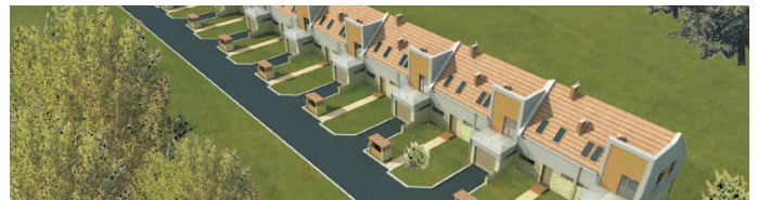
działka inwestycyjna / plot for investment

Lokalizacja: Skotniki/Działowskiego Przeznaczenie: zabudowa szeregowa Powierzchnia działki: 0,8700 ha Miejscowy plan zagospodarowania Przewidywana inwestycja: 14 domów w zabudowie szeregowej Cena: 2100 000 pln Umowa warunkowa do momentu uzyskania pozwolenia na budowę