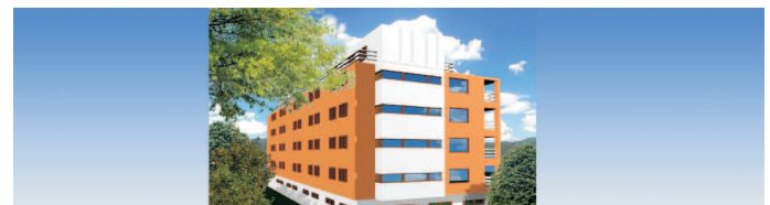
działka inwestycyjna / plot for investment

lokalizacja: Szwedzka Atrakcyjna działka dla inwestora przeznaczenie: apartamenty powierzchnia działki : 0,1 ha otoczenie: budynki XI kondygnacyjne cena: 1 200 000 PLN brutto umowa warunkowa możliwa